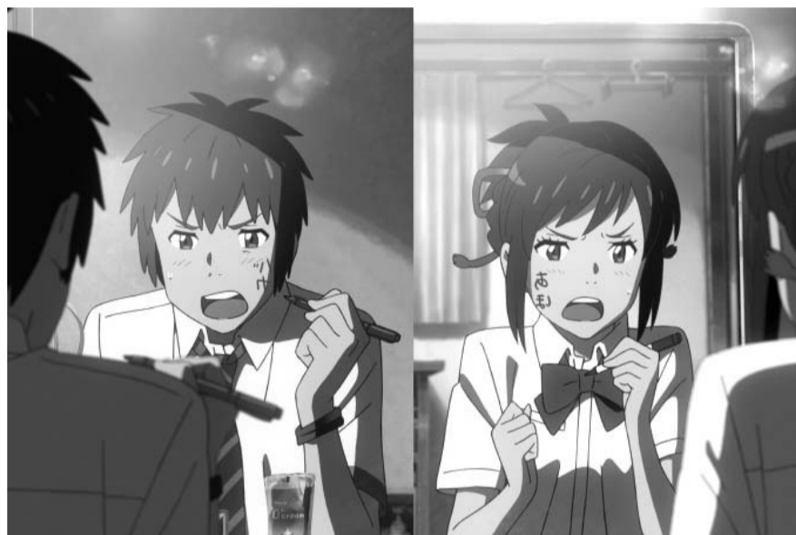
일본 애니메이션 '너의 이름은'