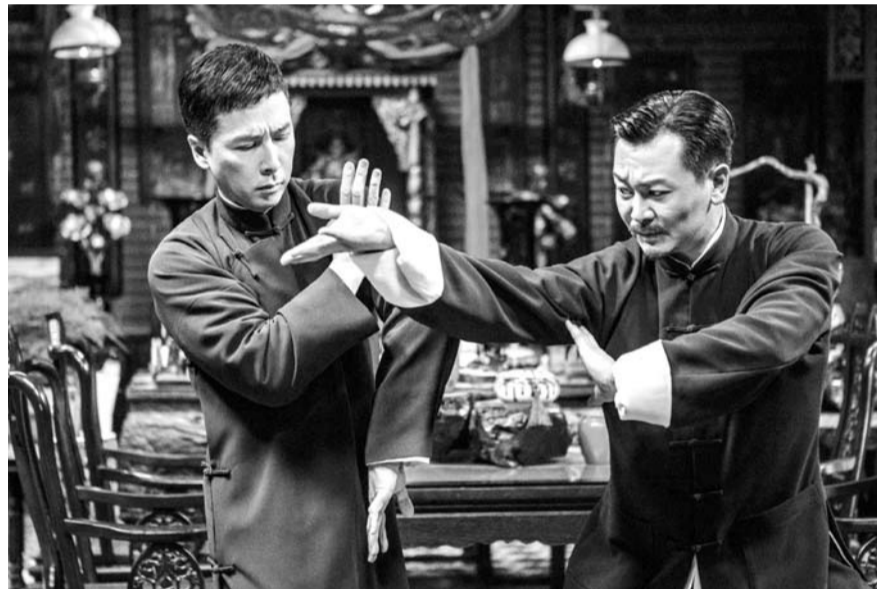
홍콩 영화 '협문4:더 파이널'