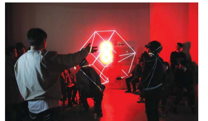
지난해 진행했던 미디어아트 창의 랩 프로젝트팀 활동 모습.

접수기간은 20일까지이며, 지원자격은 운영기간(2020년 5월 1일~2월 31일) 동안 창의 랩에서 활발한 연구·개발이 가능한 프로젝트 팀으로 동일한 프로젝트(아이디어)로 정부 또는 공공기관서 지원 받은 적이 없어야 한다. /박성천 기자 skypark@