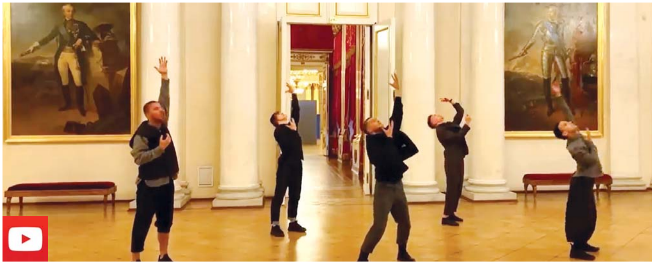
5시간 19분 28초 분량의 영상으로 만날 수 있는 러시아 상트페테르부르크 에르미타주 미술관 모습.

러시아 상트페테르부르크 에르미타주 미술관 588점 명화·미술관 풍경 5시간19분 영상 공개 뉴욕 메트로폴리탄 미술관 '360도 프로젝트' 구겐하임·모마현대미술관·루브르 박물관 등 무료 온라인 투어...다양한 작품·내부 공개