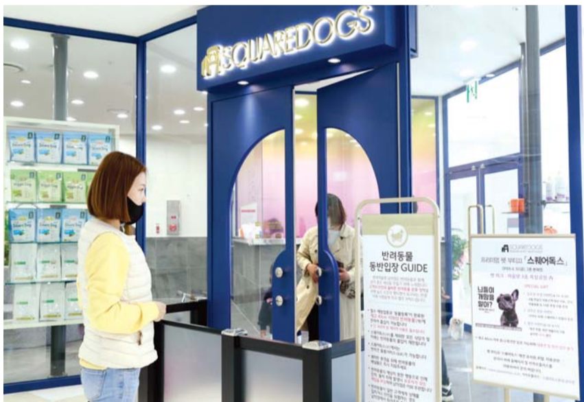
12일 롯데아웃렛 남약점에 새로 문을 연 펫 부티크 ‘스퀘어독스’를 찾은 한 고객이 이 용안내문을 살펴보고 있다.

반려동물가정 1000만 시대에 맞춰 지역 유통가가 관련 수요잡기에 나섰다. 롯데아웃렛 남약점은 지난 10일 광주·전남지역에서 처음으로 애견 유치원·호텔·미용샵·카페 등을 갖춘 프리미엄 펫 부티크 ‘스퀘어독스’를 3층 본매장에 개장했다고 12일 밝혔다. 990㎡(300평) 규모인 이 매장은 반려동물 가정을 위한 일대일 교육과 행동교정, 수중 리빙머신 등 아쿠아테라피 재활치료, ‘도가’(도그+요가) 수업 등을 진행한다. 반려동물 ‘픽업’(등하교) 서비스를 갖췄으며 200평 규모 애견파크는 고객 누