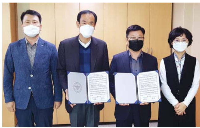
자 등 사회적 약자에 대한 상담·치료도 진행하며 종합적인 보호활동을 추진할 계획이다. /정병호 기자 jusbh@

치매환자 등 실종을 예방하고 빠르게 발견할 수 있는 촘촘한 안전망을 구축하는 것이다. 동부경찰은 동구청 치매안심센터와 업무협약(MOU)을 통해 치매환자 등 사회적 약자 원스톱 서비스를 제공하기로 했다. 치매환