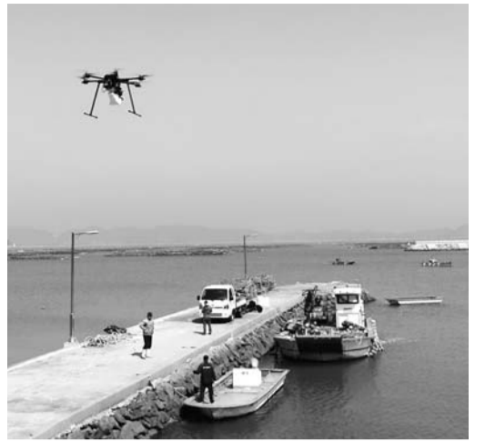
완도군이 행정안전부의 '지역 밀착형 드론 배달점 설치' 공모사업에 최종 선정됐다.

양성 교육, 청년취업 맞춤형 멘토링 사업 등 은퇴자 경력을 활용한 18개 사업이 있다. 광양시는 은퇴자 지원 시책에 총 330억원을 투입한다. 별도의 전담팀을 구성해 사업을 구체화하고 사업 시행 우선순위에 따라 예산 확보 등 단계별로 추진해 나갈 방침이다. 임채기광양시전략정책담당관은 "이번 대책을 토대로 지역 실정에 맞는 차별화된 시책을 추진해 은퇴자의 성공적인 인생 2막을 적극 지원하겠다"고 말했다. /광양=김대수 기자 kds@kwangju.co.kr