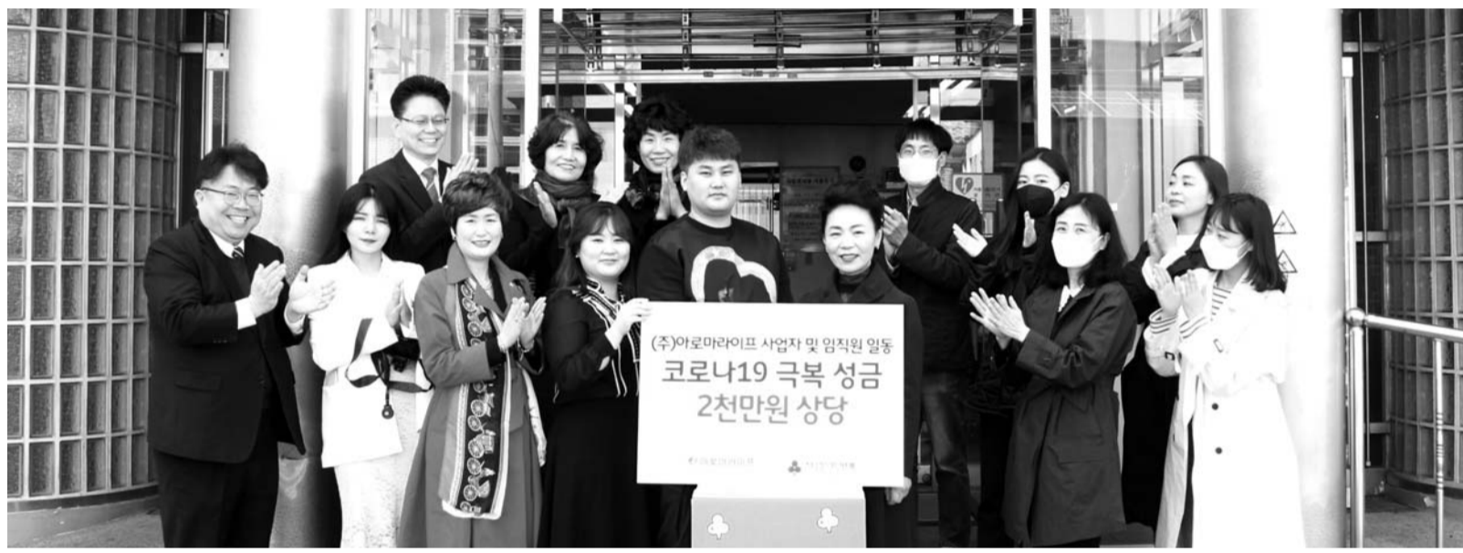
썬아로마라이프 임직원 등이 27일 광주사회복지공동모금회 관계자와 함께 북구노인종합복지관을 방문해 코로나19로 어려움을 겪고 있는 어르신들에게 2000만원 상당의 후원물품을 전달하고 있다.