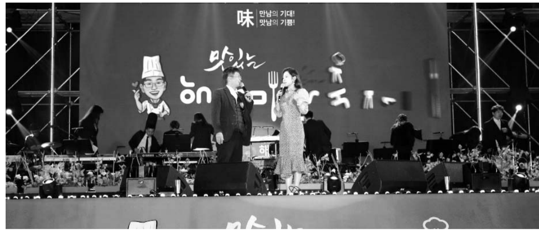
지난해 10월 열린 ‘해남미소축제’에 초대가수로 방문한 가수 홍자가 외가인 해남과의 인연을 소개하고 있다.

지난 20일에는 팬클럽 카페에서 일괄 주문을 받아 30여개 품목 646건 1200만원 상당의 농수산물을 구매, 21-23일 회원 가정에 배송했다. 지난 23일부터 30일까지는 홍자시대 이벤트 게시판에 구매 후기를 올린 회원에게 추첨을 통해 미니전북 세트를 선물로 증정한다. ‘홍자시대’는 구매 후기 열기 등을 파악해 2차 주문도 고려 중이다. ‘홍자시대’는 코로나19로 판로가 막혀 어려움을 겪고 있는 해남 농어민들에게 따뜻한 마음을 전달하고자 이번 이벤트를 마련했다.