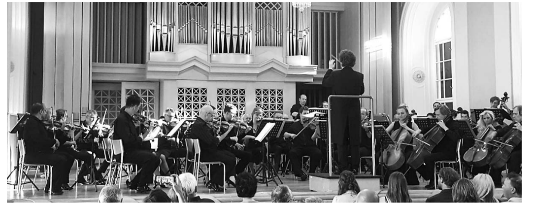
지난 2018년 체코 프라하에서 체코내셔널심포니오케스트라 연주로 진행된 '님을 위한 행진곡' 공연 장면.