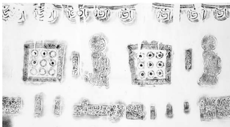
광주 원효사 동종