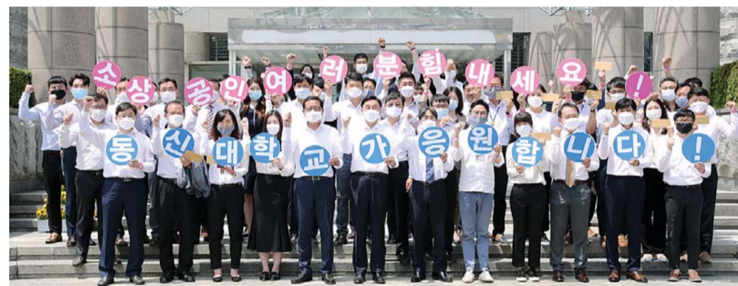
동신대 교직원들이 12일 ‘소상공인 여러분 힘내세요!’, ‘동신대학교가 응원합니다!’라는 피켓을 만들어 지역 소상공인들을 응원하는 캠페인을 펼치고 있다.

역 사당 상품권 구매하는 데 뜻을 모았다. 340여 교직원들은 총 1710만 원의 상품권을 구매, 지역 자영업자들에게 큰 보탬이 될 것으로 보인다. 이에 앞서 동신대는 나누사가 추진한 ‘사랑의 딸기 사주기 운동’에 동참하는 한편 지역 화훼농가를 위해 장미꽃 사주기 운동도 펼쳤다. /채희중 기자 chae@kwangju.co.kr