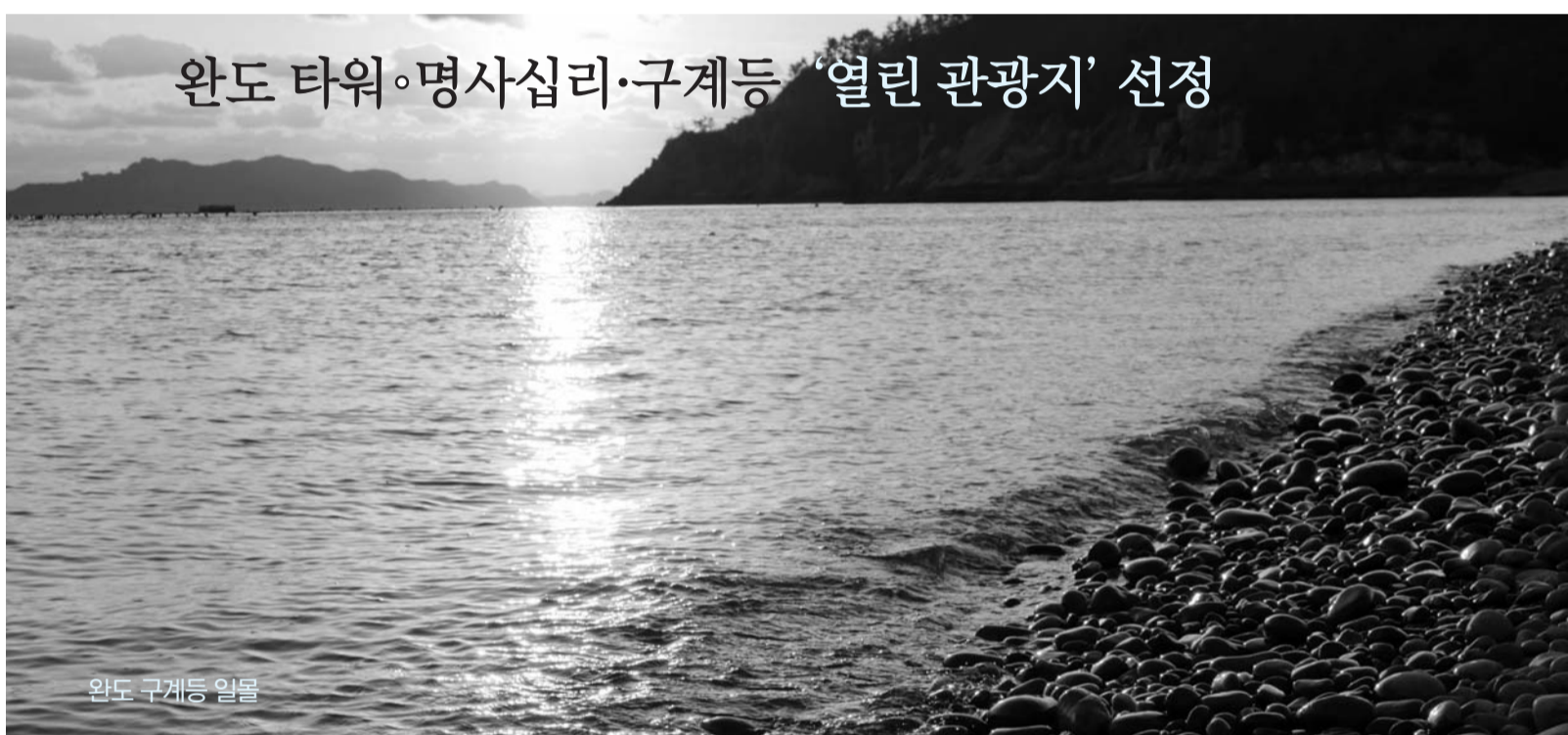
완도 구계등 일몰