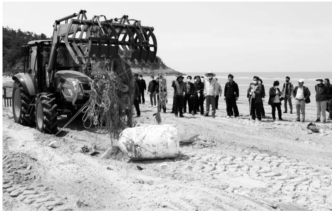
신안군은 최근 자은면 외기해수욕장에서 전국 최초로 개발한 해양쓰레기 수거 특수장치를 시연했다.

또 10억원의 예산으로 해상·바닷가에서 유입된 쓰레기 수거, 임시저장을 위한 선상집하장 8개소, 육상집하장 10개소도 설치할 예정이다. 집하장에 모인 페스티로폼의 자원화를 위해 9억원을 들여 해양쓰레기를 압축하는 기계인 감용기 설치 지역을 6개소로 확대한다. 48억원의 국비 사업에 선정된 환경정화선도 수중장치를 개발, 해양부유물을 획기적으로 처리할 예정이다. 신안은 바다면적이 1만2654km 2 로 서울시 면적의 22배에 달한다. 해마다 어구와 스티로폼, 페트병 등 국내외 해양쓰레기 5000여이 유입돼 해양생태계 파괴, 해양경관 훼손, 양식장 등에 2~3차 피해를 일으키고 있다. 신안군은 지난해 말 기준 해양쓰레기 정화사업(11억), 수거·처리사업(4억), 태풍피해 복구사업(10억) 등 사업비 25억원을 투입해 4100여t을 처리했지만, 매년 1000여t을 처리하지 못해 쌓이고 있는 실정이다. 특히 낙도와 무인도는 접근성 및 수거작업 여건