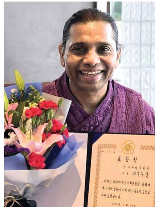
이로도 광주를 찾아온 이주민들이 잘 정착할 수 있도록 도움을 아끼지 않을 거예요. 이주민이 행복한 ‘인권·민주의 도시’ 광주를 만드는 데 앞장서고 싶어요.

“광주는 제 고향이고, 사랑하는 도시입니다. 앞으로도 광주를 찾아온 이주민들이 잘 정착할 수 있도록 도움을 아끼지 않을 거예요. 이주민이 행복한 ‘인권·민주의 도시’ 광주를 만드는 데 앞장서고 싶어요.”