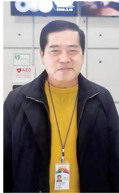
와 문화를 가르쳐주며 보람치게 살고 싶다”고 말했다.