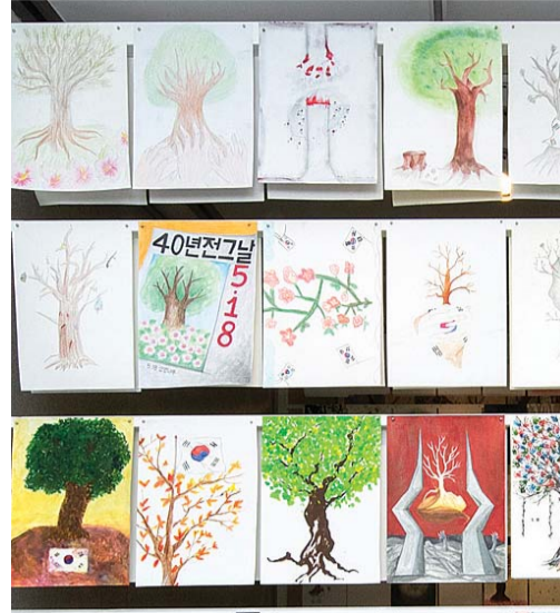
동아이고 학생들이 제작한 5·18 생명나무 드로잉

그는 “5·18에 대한 왜곡과 오류 등 주관적인 자료들이 많아 혼란스러웠다”며 “5·18 민주화운동 기