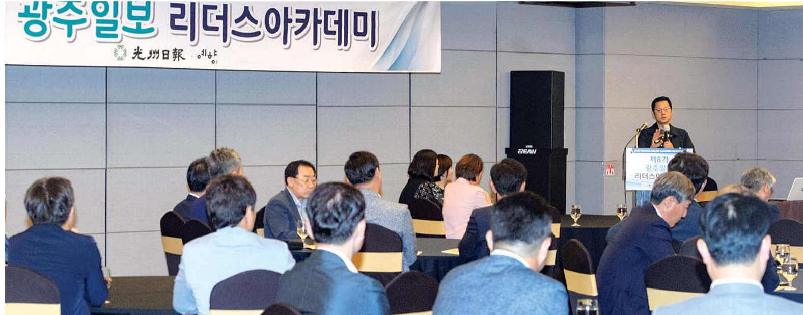
26일 광주시 서구 리마디프라자 광주호텔에서 열린 제8기 광주일보 리더스 아카데미에서 원우들이 강연을 경청하고 있다.

세월호 참사 현장의 기록, 한국 다큐 최초 아카데미상 후보 올라 “고정관념 탈피해 타자 관점에서 생각하고 관계 맺어야 훌륭한 예술가”