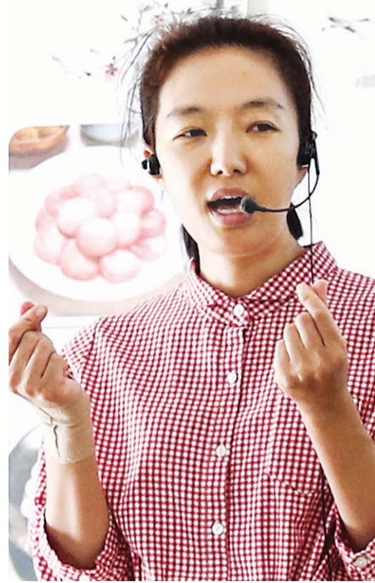
영이 전면 취소된 것이다. "소득이 급격히 줄면서 많이 힘들었습니다. 그 때 한 이웃이 마을기업을 추천해 줬어요. 힘들고 돈이 안 되면 금방 포기해 버리는 어느 귀농인과는 다른

하지만 귀농하자마자 어려움이 닥쳤다. 2014년 세월호 사태, 메르스 사태 등이 터지며 체험학교 운