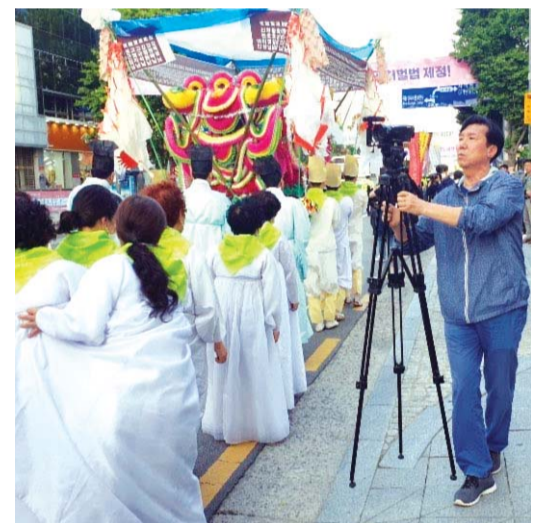
5·18전국시청자취재단 서울팀이 오월추모제 현장을 취재하고 있다.

지난달 18일에는 경기취재단이 광주로 내려와 최근 새 단장을 마친 전일빌딩 245를 집중 조명했다. 245개의 헬기 총탄 자국이 80년 오월의 아픔을 그대로 보여주는 전일빌딩의 이모저모를 취재하고 80년 오월 사진전을 통해 당시 모습을 영상에 담았으며, 양동시장·주남마을·전남대·금남로 등 오월길도 다녔다. 경기취재단이 촬영한 영상은 시청자참여프로그램을 통해 경기지역 전역에 방송될 예정이다. 서울취재단은 '20년 오월 서울 그리고 광주'라는 제목으로 서울에서 열리고 있는 5·18 40주년 사진