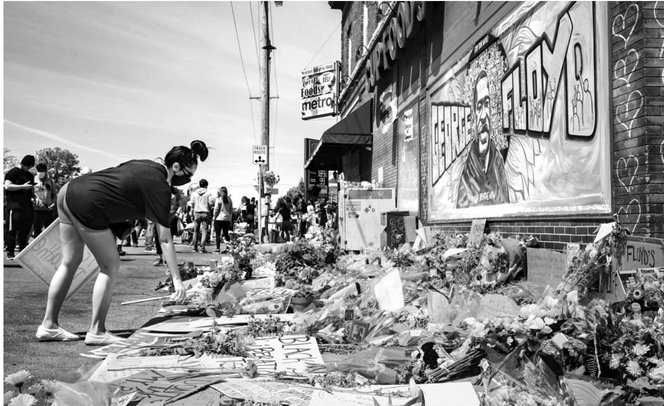
흑인 남성 조지 플로이드가 경찰의 가혹 행위로 숨진 것을 애도하는 미국 미네아폴리스 주민들이 지난 31일(현지시간) 그가 경찰에 연행됐던 현장에 마련된 임시 추모소를 찾아 헌화하고 있다.

곳곳 약탈·방화 격렬 시위 52년만에 동시 통금령 충격 잇따르며 최소 4명 숨져 트럼프 한때 병커 피신도