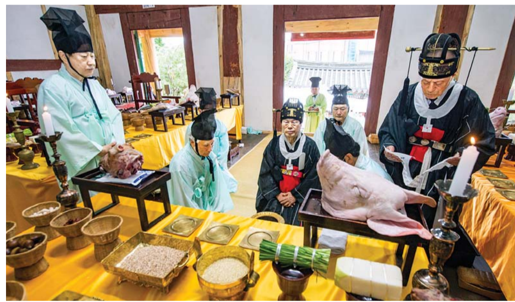
춘기 석전대제가 3일 광주시 남구 사직동 광주향교 대성전에서 열렸다. 석전대제는 매년 봄과 가을 2차례 공자를 기리는 제사다. 올해는 코로나19로 인해 제례가 늦어졌다.