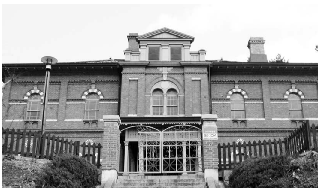
일제강점기 수탈의 심장부였던 옛 일본영사관(목포근대역사관 1관). 목포문화연대는 이 곳에 '친일청산 단죄비' 건립을 추진한다.