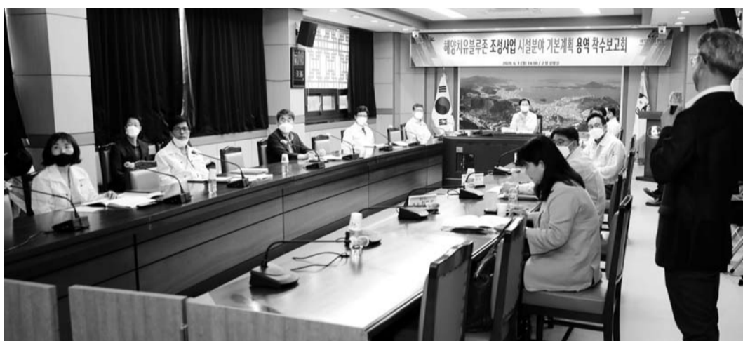
완도군이 청산도에 해양치유공원을 조성하기로 하고, 최근 기본계획 용역 착수 보고회를 개최했다.