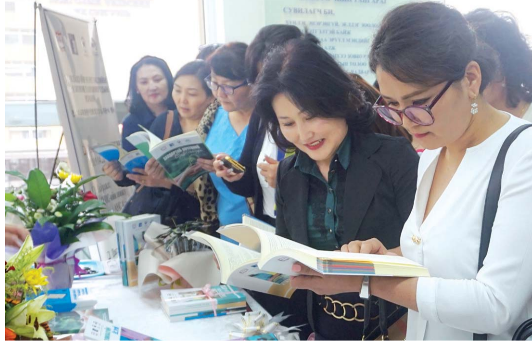
지난해 4월 몽골민족대학교에서 열린 간호학 전공교재 출판기념회에서 몽골 간호계 인사들이 교재를 살펴보고 있다.