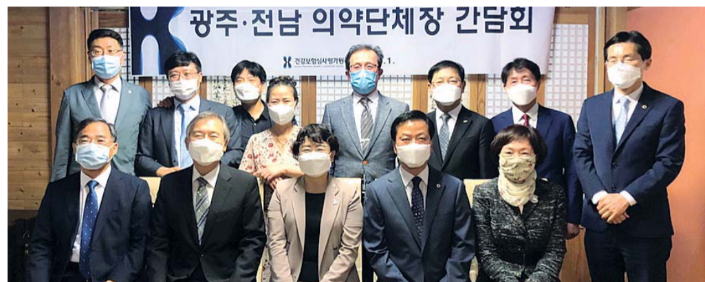
건강보험심사평가원 김선민(앞줄 가운데) 원장이 최근 광주지원을 시작으로 전국 지원 방문에 들어갔다. 취임 이후 첫 일정으로 광주지원을 방문한 김 원장은 2020년도 주요 추진사업을 점검하고 지역 의약단체와의 간담회를 통해 ‘찾아가는 소통’의 자리를 마련했다.