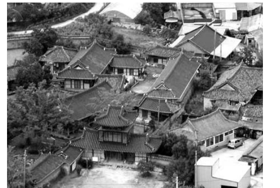
문화재청 '고택 증강집 활용 사업'인 '영광 매간당고택 1박2일 체험 프로그램'이 이달부터 시작됐다. 사진은 국가민속문화재 제234호 매간당고택.

영광군은 이달부터 오는 11월까지 국가민속문화재 제234호인 매간당고택 일원에서 '매간당고택에서 인생샷 찍고, 하루 살아보기' 프로그램을 운영한다고 8일 밝혔다.