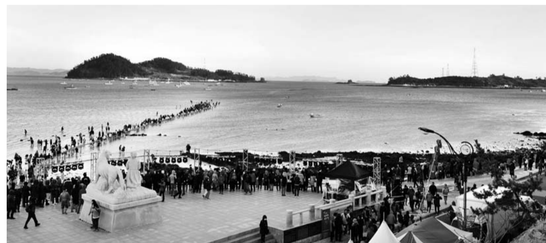
진도 신비의 바닷길 축제가 문화체육관광부의 '명예 문화관광축제'에 선정됐다.