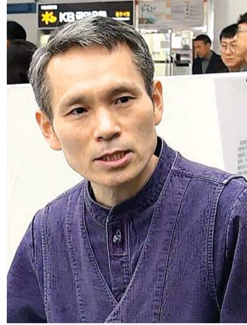
“수집품을 통해 고려인 역사·문화를 후세에게 알리고 싶어요. ‘강제이주당한 불쌍한 외국인 노동자’로 치부되곤 하는 고려인에 대한 편견을 깨고 진짜 고려인의 삶을 보여주고 싶습니다.”

그는 “광주고려인마을은 고려인이 주인의식을 갖고 공동체를 이뤄 살고 있는 가장 모범적인 마을”이라며 “광주 또한 고려인처럼 아픔을 겪었고, 민주·평화·인권을 지향한다. 고려인과 더불어 사는 광주에서 앞으로도 고려인을 위해 활동하고 싶다”고 말했다.