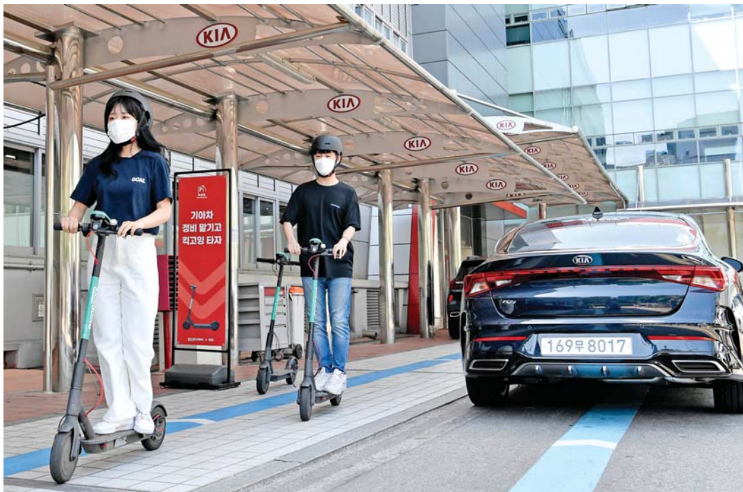
기아차는 국내 최대 규모의 전동킥보드 서비스업체인 '올룰로'와 제휴를 맺고, 직영서비스센터 방문 고객을 대상으로 전동킥보드 서비스를 실시한다.

렉서스코리아는 오는 7월31일까지 전국 렉서스 딜러 서비스센터에서 '된 어게인 씬머 서비스 캠페인'을 진행하면서 고객 서비스 대기 시간을 활용해 렉서스의 프리미엄 하이브리드 스포츠유틸리티