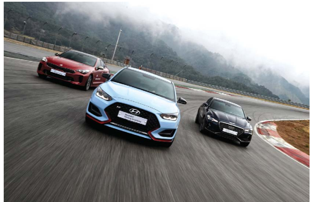
현대자동차그룹은 오는 7월18일부터 강원도 인제스피드움에서 현대차·기아차·제네시스 차량의 성능을 브랜드별로 체험할 수 있는 '2020 현대자동차그룹 드라이빙 익스피리언스'를 진행한다.

현대차는 아반떼, 쏘나타, 벨로스터 N, 기아차는 K3 GT, K5, 스타링, 제네시스는 G70을 체험할 수 있으며, 운전자 주행 능력과 참가 조건에 따라 ▲운