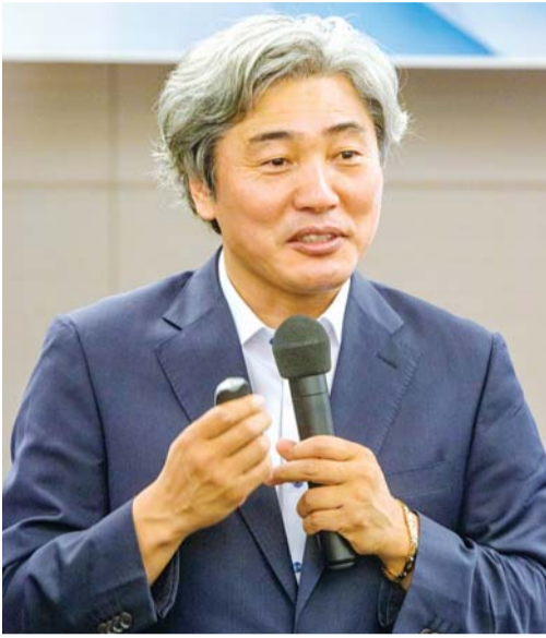
송창영 재난안전기술원 이사장