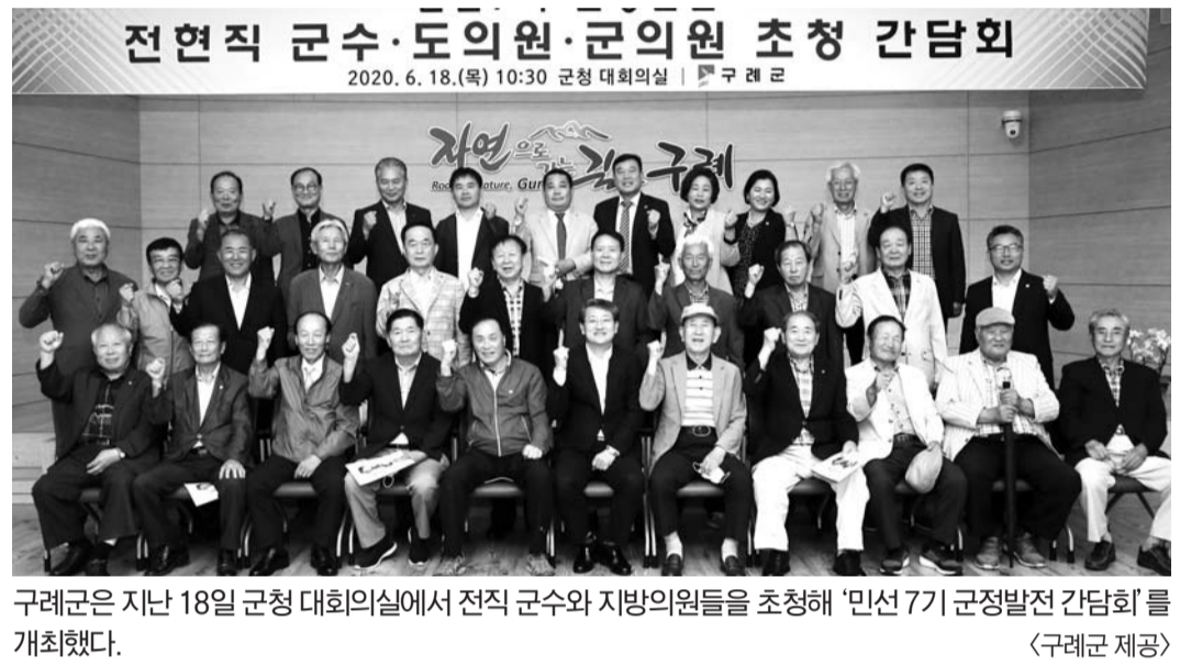
구례군은 지난 18일 군청 대회의실에서 전직 군수와 지방의원들을 초청해 ‘민선 7기 군정발전 간담회’를 개최했다.