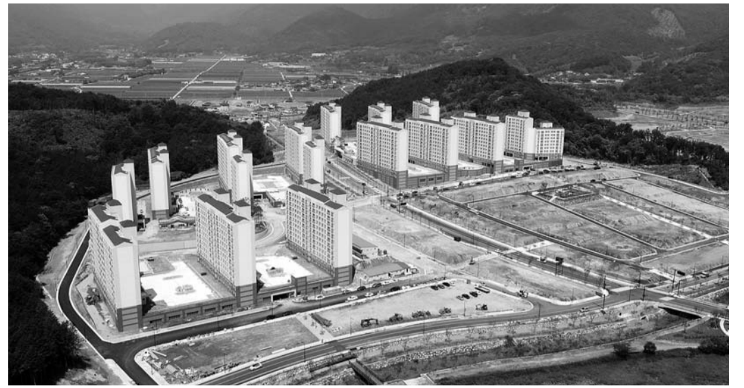
연말 입주를 목표로 진행중인 첨단문화복합단지의 공동주택 전경.

으며 입주 후 예상되는 문제점을 미리 보완하기 위한 마무리 공사가 한창으로 이달 말까지는 준공에 필요한 행정절차를 완료할 계획이다. 680세대의 공동주택은 연말 입주가 이뤄질 것으로 보인다. 담양군 관계자는 "현재 99%의 분양률을 보이고