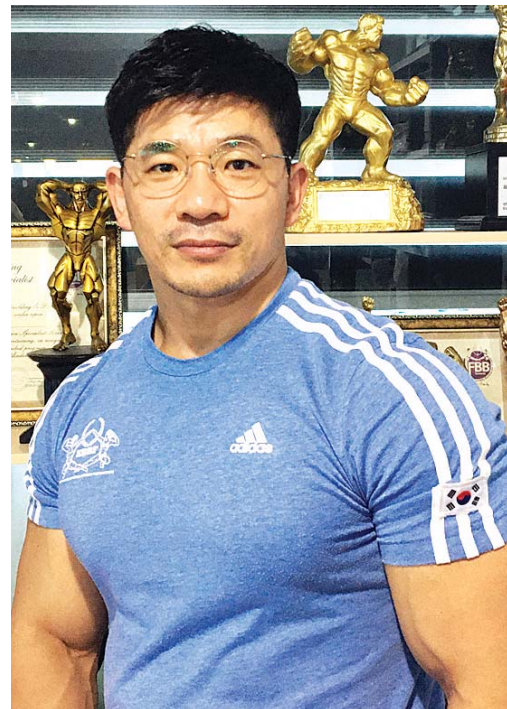
발전하고, 좋은 후배들을 양성해 우리나라 보디빌딩 발전에 앞장서고 싶습니다.

“지금까지 잘 이겨내 왔듯이, 새로운 도전 앞에서 멈추지 않겠습니다. 앞으로도 제 스스로 더욱