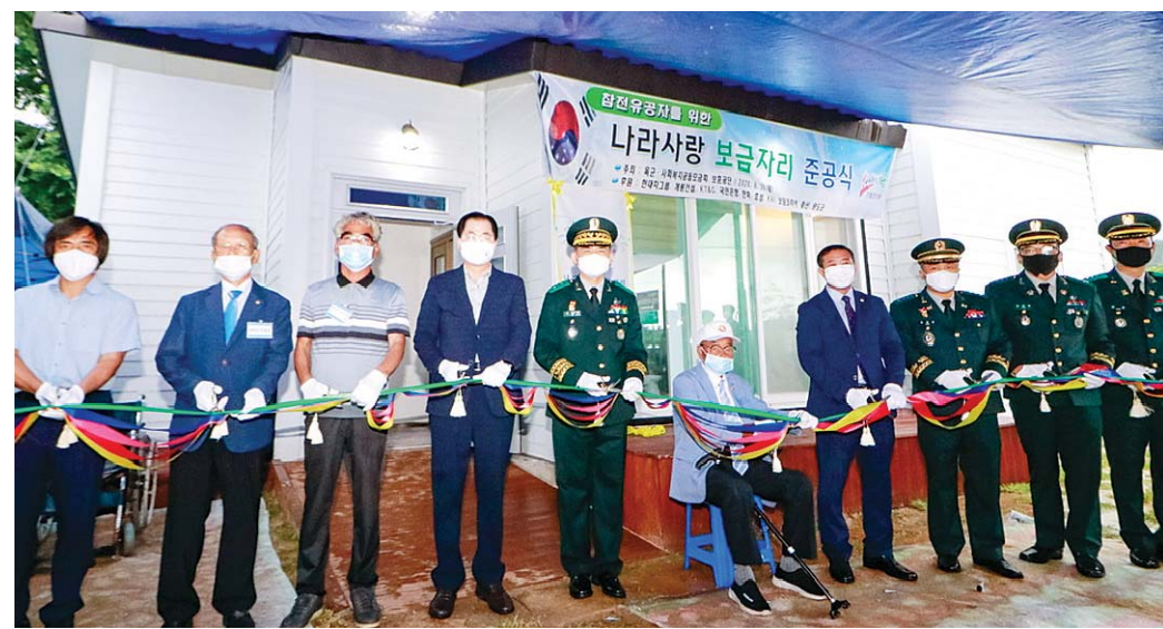
라사랑의 실천이자 후손들의 본분이다”며 “선배 큰 보람을 느낀다”고 말했다.