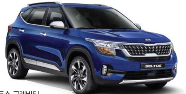
2021 셀토스 그레비티

기아차 광주1공장에서 생산되는 인기 모델 차량 셀토스의 연식 변경 모델이 출시됐다. 기아차는 셀토스의 연식변경 모델 '2021 셀토스'를 출시하고 본격적인 판매에 돌입했다고 1일 밝혔다.