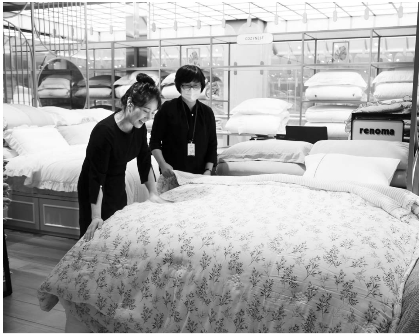
여름철, 기능성 이불 할인 판매 2일 광주신세계를 찾은 고객 8층 이불매장에서 여름철 기능성 이불을 살펴보고 있다. 이 매장은 재고가 소진될 때까지 모달, 인견, 마 소재 여름 이불을 할인 가격(엘레인 모달 21만 4400원·로바스 인견 15만6000원)에 내놓는다.

한국전력은 냉방 수요가 많은 여름철을 맞아 취약계층의 에너지비용을 지원하는 '하계 에너지바우처' 신청을 연말까지 받는다고 2일 밝혔다. 에너지바우처 지원대상은 국민기초생활보장법상 생계·의료급여 수급자 중 노인, 장애인, 영유아, 임산부 등이 포함된 가구로, 전국 약 67만가구가 추정된다. 1인 가구 기준 바우처 지급 금액은 지난해 5000원에서 올해 7000원으로 올랐다. 신청은 연말까지 할 수 있지만 여름철인 7월1일~9월30일 바우처를 사용할 수 있다. 여름 바우처 사용 후 잔액은 겨울 바우처로 옮겨준다. 신청은 주민등록상 거주지 읍·면·동 행정복지센터에 방문해 할 수 있다. 또 코로나19로 어려움을 겪고 있는 취약계층과 소상공인을 위해 전기요금 납부기한 유예를 추가 연장한다. 4~6월분에 이어 7~9월분까지의 전기요금 납부기한을 3개월씩 추가로 연장한다. 유예 신청은 한전 콜센터 또는 홈페이지를 통해 신청할 수 있으며, 전기요금이 관리비 고지서에 포함되어 청구되는 가구는 관리사무소를 통해 신청할 수 있다.