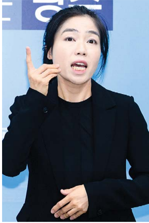
다고 한다. 호남대를 다녔던 중 우연히 만난 한 농인 학생이 계기였다. 김씨는 강의 내용을 알 수 없어 어려워하는 농인

김씨는 대학교 4학년인 2003년 수어통역사 자격증을 취득하고 수어 통역 일을 시작했다. 김씨는 처음엔 ‘호기심’으로 수어를 배우게 됐