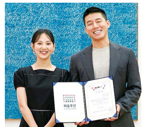
이들은 “코로나19로 지쳐 있는 국민들에게 미술이 가지고 있는 치유의 힘이 달기를 기원한다”고 말했다. /연합뉴스

홍보대사 김무열·윤승아 부부는 공식 영상 촬영 등 미술주간을 알리는 홍보 활동에 참여할 예정이다. /연합뉴스