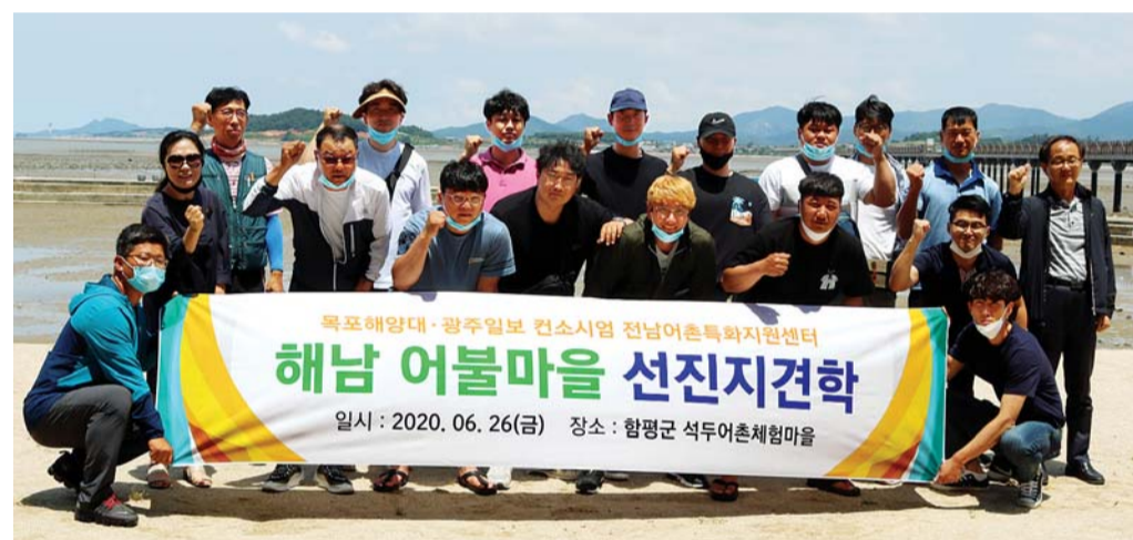
해남 어불어촌계 회원 20여명이 최근 함평 석두어촌계를 찾아 어촌 체험·편의시설 등을 견학하고, 관광객 맞이 프로그램과 운영시스템에 대해 교육을 받았다. 해남 어불어촌계는 2021 어촌뉴딜 300 사업 공모에 참여할 예정으로, 김과 전복 양식업이 발달했으며, 이를 가공·유통하고 관광 프로그램을 가동해 소득 향상과 어민 삶의 질 향상에 나설 방침이다.