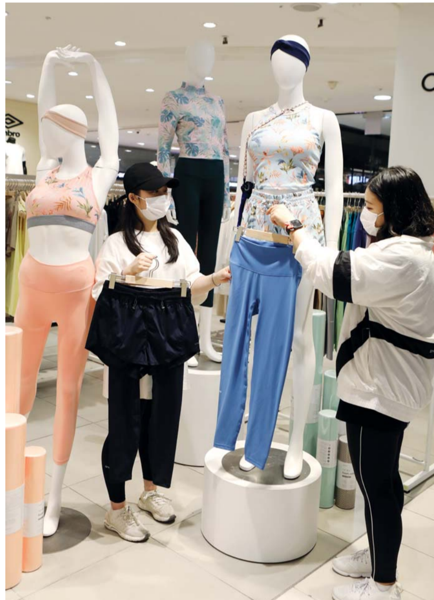
‘물놀이 포기못해’ 워터 레깅스 할인 19일 롯데백화점 광주점을 찾은 고객들이 5층 ‘안다르’ 매장에서 체온 유지와 자외선 차단 기능을 높인 ‘워터 레깅스’를 선보이고 있다. 이 매장은 관련 제품을 이달 말까지 최대 20% 할인 판매한다.

균 15만원으로, 지난해 평균 취업 준비 비용(29만원)의 절반 수준이었다. 대면 방식을 통한 취업준비와 비교해서는 비대면 효율성이 떨어진다는 응답률이 35.5%에 달했다. '비슷하다'는 의견은 39%, '효율이 높다'는 응답률은 25.6%였다. 전체 응답자의 10명 중 7명 이상(74.6%)은 비대면 취업 준비가 '긍정적'이라고 답했다. 그 이유는 '시간과 장소에 구애 받지 않아서'(69.7%·복수응답)를 가장 많이 꼽았고, '코로나19 감염을 예방할 수 있어서'(65.8%)가 바로 뒤를 이었다. '오프라인 대비 비용을 절감할 수 있어서'(38%), '여러 번 반복해서 열람/수강할 수 있어서'(21.5%), '대면보다 효율성이 높은 것 같아서'(17.2%) 등도 이유로 들었다. /백희준 기자 bhj@kwangju.co.kr