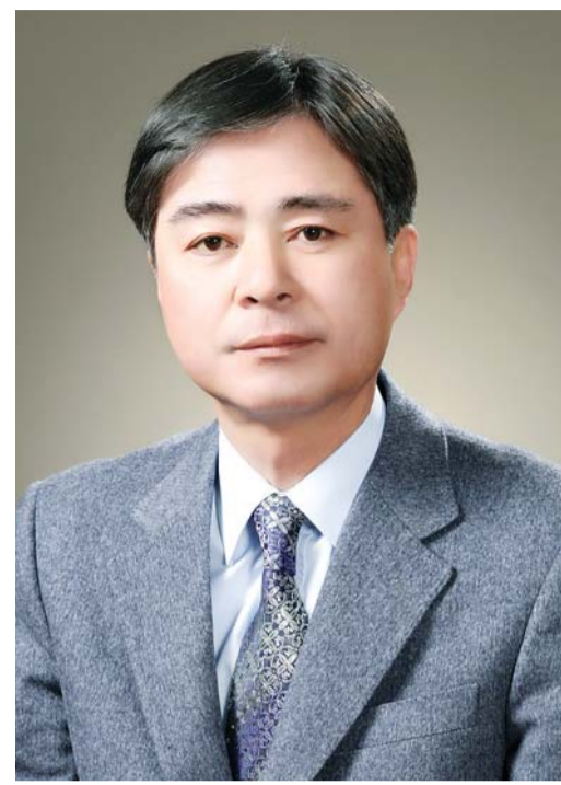
“100년 역사와 기념사업은 유은가족의 역량이며 노력입니다. 역사와 전통을 모으고 끌어내 학원 100주년을 빛내고, 나아가 또다른 100년을 열 매 맺을 수 있도록 노력하겠습니다.”

수 있도록 동문들의 도움이 절실하다”고 말했다. 기념관은 음악회, 미술 초대전 등도 개최해 지역 주민과 함께하는 문화 학습관으로 운영할 방침이다. 지난달에는 김용성(미술) 교사 초대전을 열기도 했다. 100주년 기념일 전후로는 전·현직 교원과 동문 중 유명 작가들의 미술작품을 기증·대여받아 기념전을 열 계획이다. 사이버 박물관(전산화 사업) 사업에도 박차를 가하고 있다. 광주시교육청 ‘학교역사찾기’ 사업을 통해 진행되며, 졸업앨범, 교지 등 역사적 자료들을 수집·정리해 전산화하는 작업이다. 정리된 자료는 누구나 관람할 수 있도록 개방할 방침이다. 소식지 ‘유은소식’은 지난 2016년 2월부터 발행됐다. 오는 8월 10호가 발행될 예정이며, 4개 학교 소식, 100주년 관련 소식, 동문회 소식, 유명 동문 칼럼 등으로 구성됐다. 100주년 기념연감 제작에는 동문회가 활약하고 있다. 자료를 수합해 오는 2021년 후반기에 완성할 계획이다. 조 위원장은 “유은 최선진 선생님은 일제강점기 어려운 상황속에서 ‘교육만이 살 길이다’라는 신념으로 학원을 세웠다”며 “40년 동안 유은가족의 일원으로 미려하게나마 도움을 줬다는 점에 자부심을 느낀다”고 말했다.