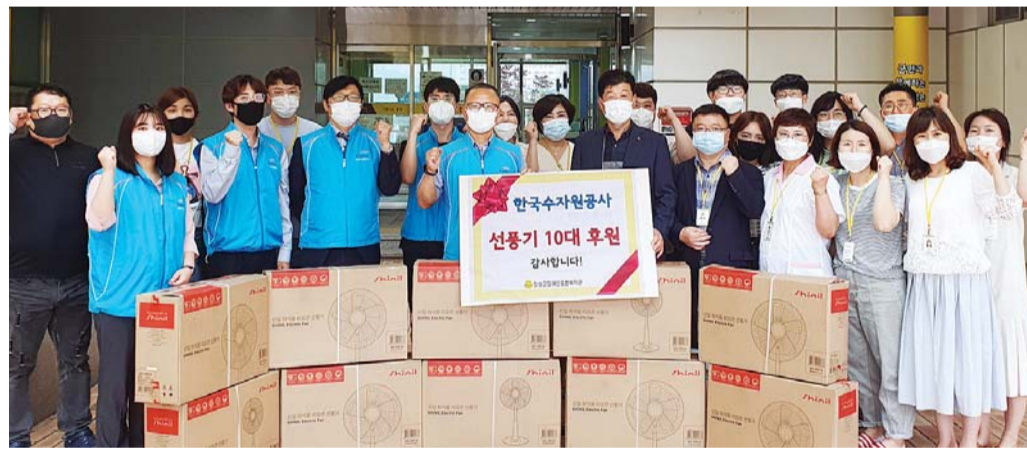
한국수자원공사 영섬유역본부 산하 전남북부권지사 직원들이 22일 장성 장애인종합복지관과 프란치스코의 집, 합령 청소년 상담복지센터에 선풍기 25대를 기증했다.