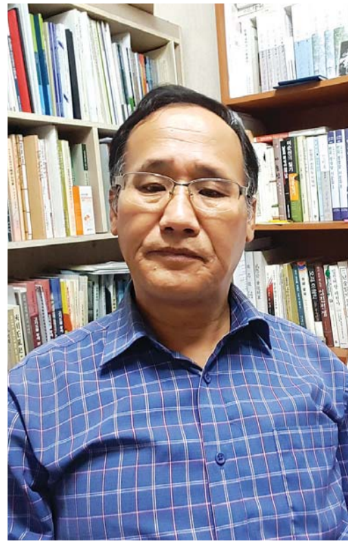
박 소장은 “기존의 이순신 관련 인물 연구는 호남절의록이 나 호남삼강록 등에서 많이 인용됐습니다. 그러나 관직과 연대, 가족관계, 해전참전 사실관계가 상당수 오류가 있어요. 앞으로도 이를 바로잡는 연

“기존의 이순신 관련 인물 연구는 호남절의록이 나 호남삼강록 등에서 많이 인용됐습니다. 그러나 관직과 연대, 가족관계, 해전참전 사실관계가 상 당수 오류가 있어요. 앞으로도 이를 바로잡는 연