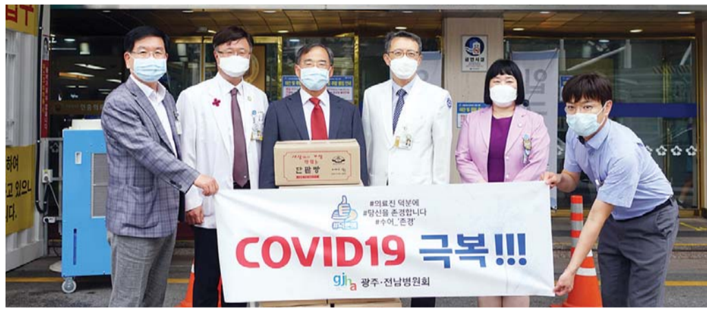
조선대병원(병원장 정중훈)은 최근 광주전남병원회(회장 이상용)로부터 코로나19 환자 치료에 매진하고 있는 의료진을 위한 격려품을 전달받았다.