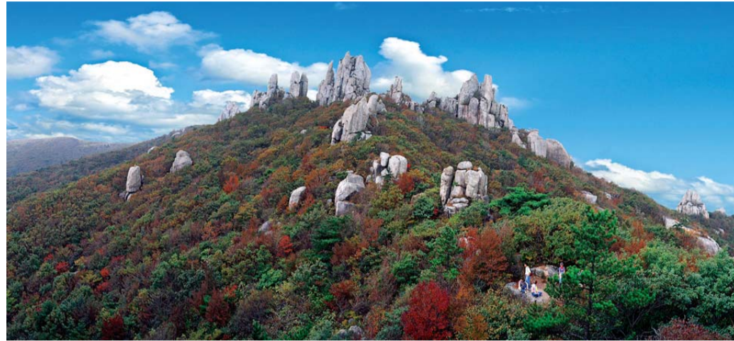
문화재청이 호남 5대 명산인 장흥 천관산을 국가지정문화재 명승으로 지정 예고했다.

기암괴석·역새 절경인 호남 5대 명산 사찰·고택 등 문화관광자원 많아 가치