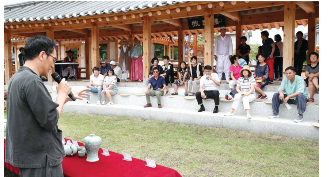
강진군이 강진을 사외재 저잣거리에서 청자 토요경매를 8일 재개한다.