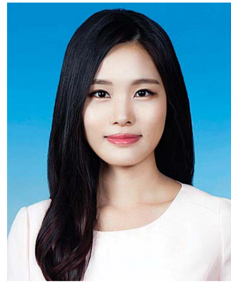
우수한 연구자로 성장해 돌아오겠습니다.”

“도민의 세금으로 유학 경비를 지원받다는 점을 매우 마음 무겁게 받아들이고 있습니다. 그리고 스스로 도비유학 장학제도는 사회적 복지정책이 아니라 인적자본 투자를 통해 경제발전을 도모하는 장기 경제정책임을 잘 이해하고 있습니다. 향후 탁월한 통찰을 통해 전라남도과 국가의 발전에 실질적으로 기여할 수 있는 방안을 제안할 수 있도록