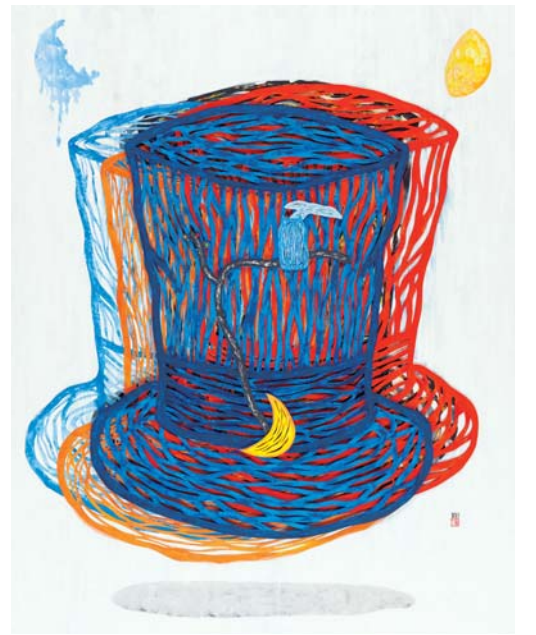
이두환 작 'one day'

무등산 자락 국윤미술관(관장 윤영월)은 지난 2018년부터 홍림장작스튜디오를 운영하고 있다. '무등길 예술산책'은 레지던시 참여작가들의 작품을 선보이는 기획전이다.