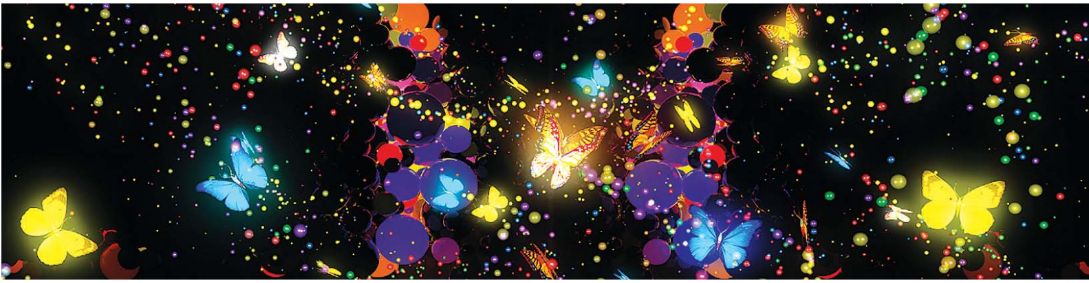
국립아시아문화전당은 오는 12월 31일까지 미디어아트 창제작 프로젝트 '아광(夜光) 전당'을 진행한다. 사진은 김창겸 작 '봄의 향연'.