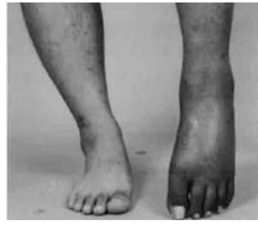
제1형 복합부위통증증후군 환자의 손상받은 좌측 다리 부종.

이며 지속적인 자발통이나 유발통으로 특징되며, 일반적으로 말단영역에서의 이상 소견을 동반한다.