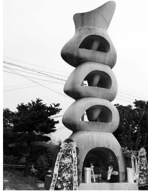
강진미술관의 새 명물인 ‘비상’.

자재를 쾌척해 지었다. 추사 김정희의 글씨와 겸재 정선의 그림을 비롯해 국내 유명 작가들의 작품 115점을 전시 중이다. 북한화가 특별전 등 매년 2~3회 특별기획전을 개최해 지역 문화예술 기반 확장에 기여하고 있다. 새롭게 설치된 조각상 외에도 높이 6.3m, 폭 4.8m 국내 최대 규모 세종대왕상을 비롯해 대형 종유석 30여 점과 나무화석 9점 등 다양한 볼거리를 제공해 강진의 이색 명소로 관람객의 사랑을 받고 있다. /강진=남철희 기자 chou@kwangju.co.kr