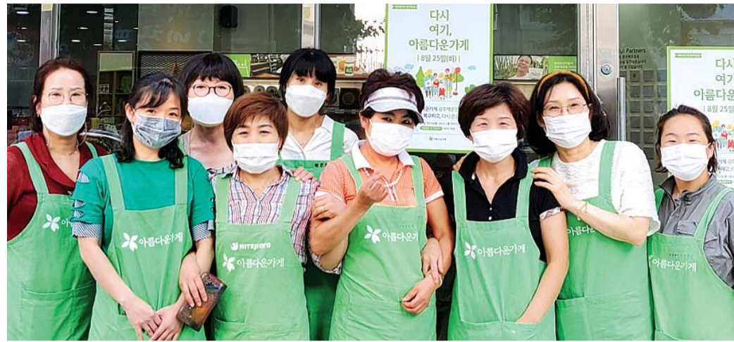
수해로 물에 잠긴 매장 복구 작업을 마치고 25일부터 재영업에 들어가는 아름다운 가게 백운점 활동천사들.

시작한다. “오픈한 지 1년 밖에 되지 않은 매장이 거의 폐허처럼 변해버려서 난감했죠. 영업을 중단하며 손해도 컸구요. 하지만 뜨거운 날씨에도 아랑곳하지 않고 참여해준 수해복구 봉사자들 덕분에 생각보다 빨리 매장 복구를 마칠 수 있었습니다. 시민들 도움으로 다시 영업을 시작할 수 있었던 셈이죠. 시민들과 직원, 그리고 활동천사분들의 도움으로 다시 영업을 시작하게 돼 감사합니다.” 신예정 아름다운 가게 광주·목포 본부장은 “40여평의 공간에서 판매할 물품은 우선 전국의 아름다운 가게에서 심시일만 도와줘 조금씩 갖추기 시작했다”며 “아름다운 가게가 더 많은 나눔을 이어갈 수 있도록 매장을 다시 채울 물품들을 수집하는 데 지역민들의 많은 참여를 바란다”고 말했다.