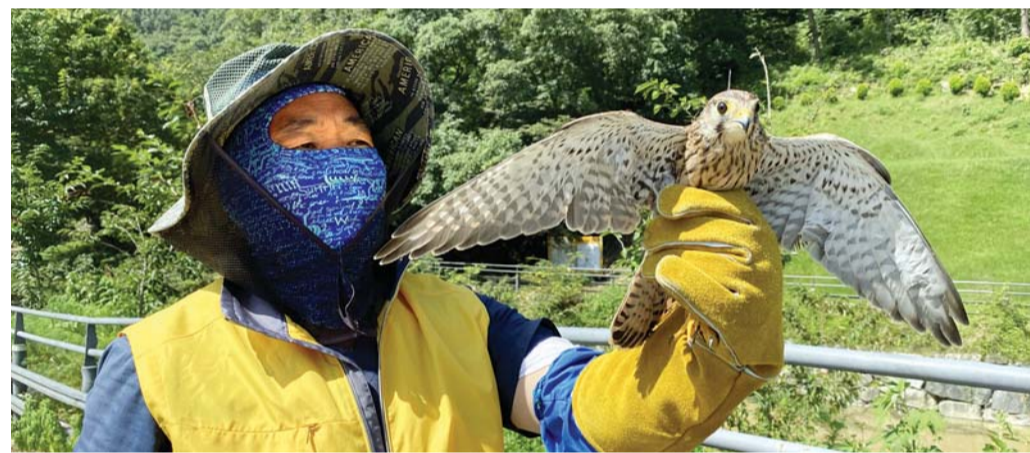
야생동물구조센터 관계자가 황조롱이를 방생하고 있다.

광주시 보건환경연구원 야생동물구조센터가 최근 황조롱이(천연기념물 323-8호) 6마리와 족제비 3마리 등을 차례로 자연으로 돌려보