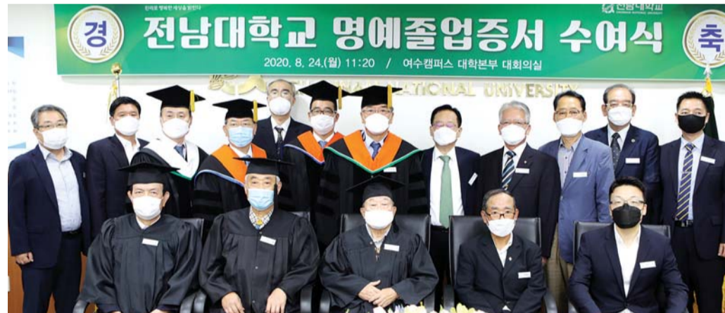
전남대학교가 전신학교 출신자들에게 명예졸업증서를 수여하고, 동문으로서 긍지와 자부심을 가져줄 것을 당부했다. 전남대는 지난 24일 여수캠퍼스에서 독립유공자 2명을 포함한 전신학교 출신 501명에게 명예졸업증서를 수여했다.