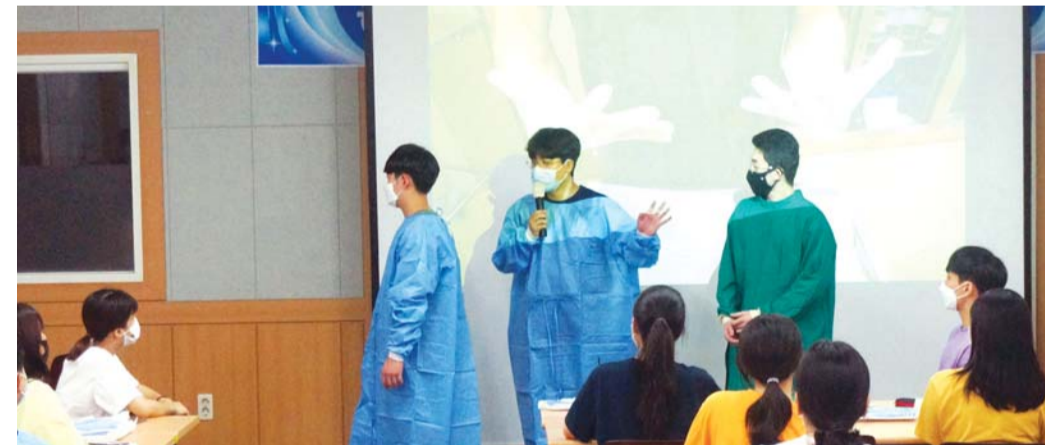
동강대학교(총장 이민숙)가 코로나19로 여름방학 기간 산업체 현장실습이 어려워진 학생들을 위해 전문가를 초청하는 등 교내 실습교육을 강화하고 나섰다. 동강대 응급구조과(학과장 최길순)는 지난 17일부터 교내 이공관에서 2학년을 대상으로 2주간 교내실습을 진행 중이다.