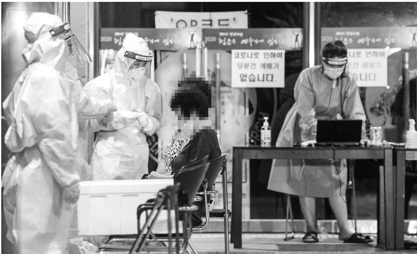
광주 284번 확진자로 등록된 60대 여성이 광주 북구 각화동의 한 교회에서 3차례 예배를 본 것으로 확인됨에 따라 25일 밤 북구보건소가 해당 교회 앞에 임시 선별진료소를 설치해 교인 600여명을 대상으로 검체를 채취하고 있다.