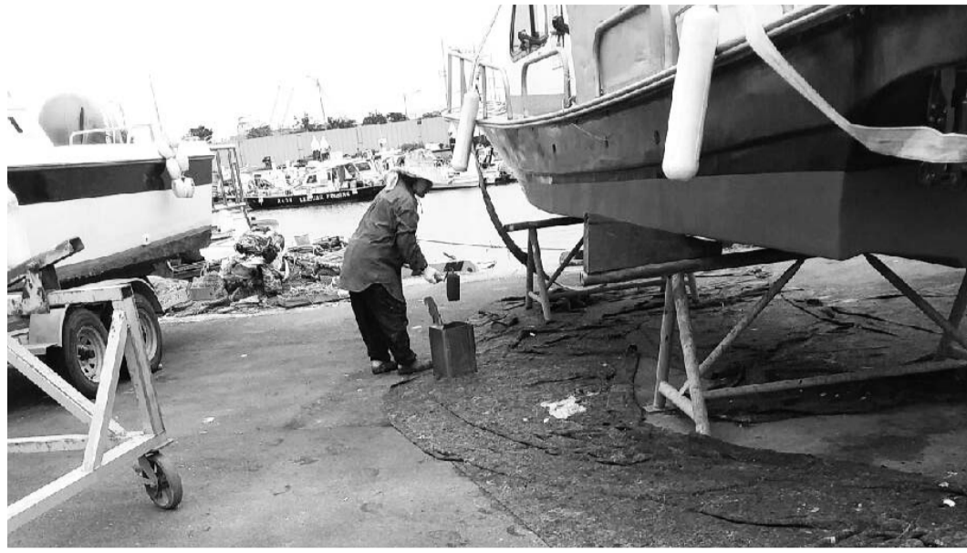
지난 27일 목포북항 선착장에서 인양기 운영자들이 무단으로 설치한 철구조물에 배를 올려놓고 불법 도색을 하고 있다.

자율관리공동체 관계자는 "대개 소형선박은 배 밑 따개비 제거, 부분 도색 등 간단한 보수는 선주가 직접 하고 있다. 목포에 소형선박 전용 조선소가 없어 일반 조선소로 가야 하는데 수리비용이 많이