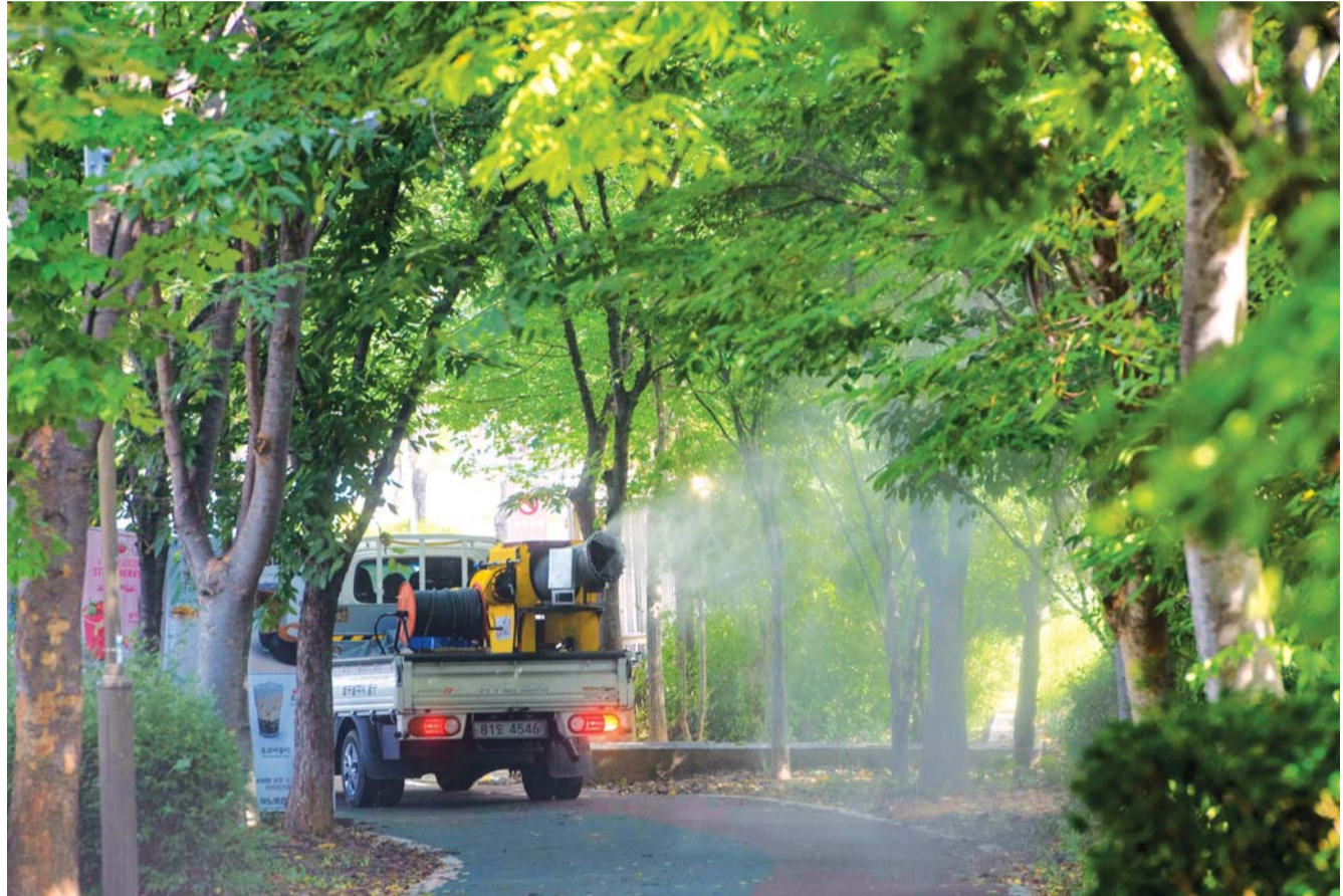
푸른길 공원 산책길 코로나 방역