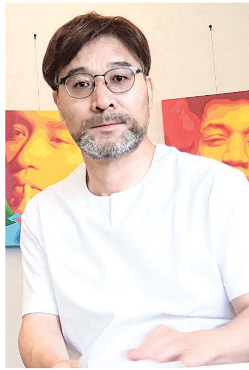
할 수 있도록 노력하겠습니다. 많은 분들이 응원해 주시고, 섬에 관심을 갖고 함께 주시길 바랍니다. /유연재 기자 yjyou@

“시민들이, 지역 주민이 섬을 이해하고 공유할 때 비로소 섬 연구가 의미 있습니다. 연구원은 지역과 협력하는 중요한 연구 기관으로서 역할을 다