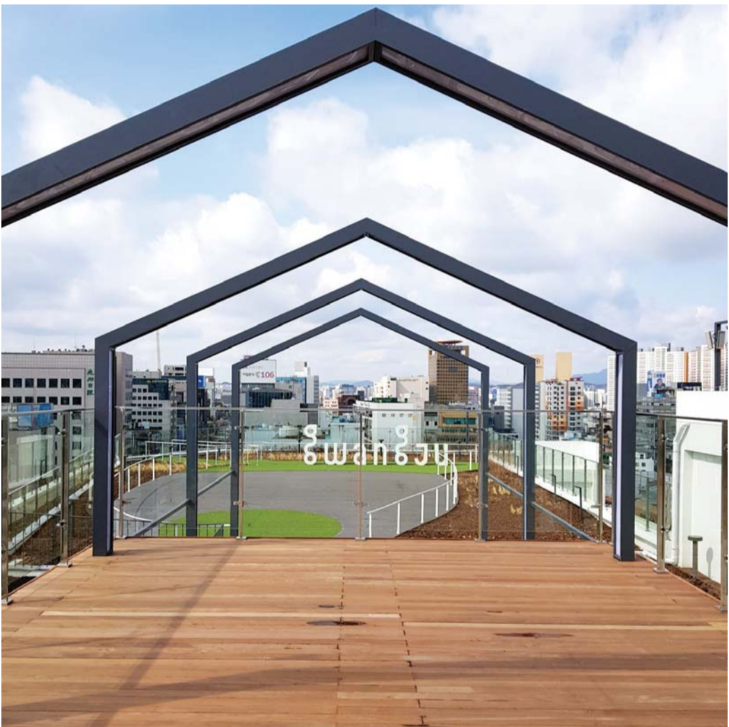
'전일빌딩245'가 '2020 대한민국 공간문화대상' 최우수상(국무총리상)을 수상했다. 사진은 건물 옥상 휴게공간 전일 마루.