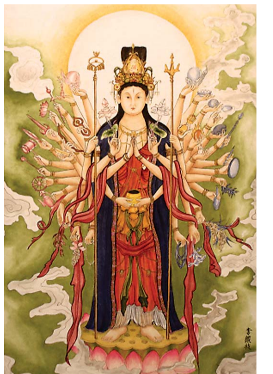
이은지 작 '천개의 희망, 천개의 약속'