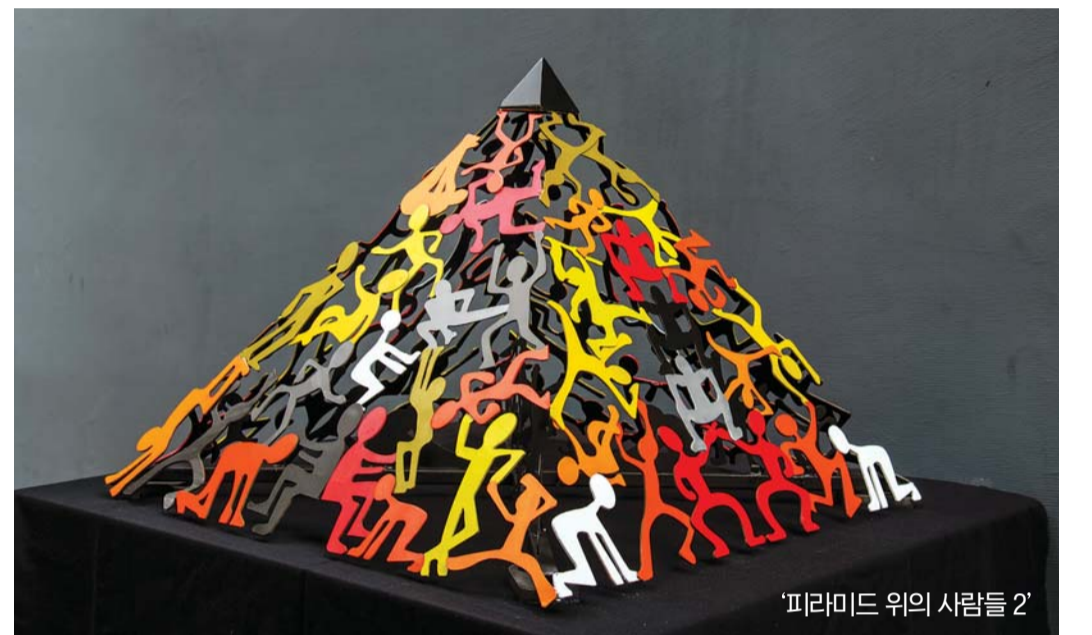
'피라미드 위의 사람들 2'

전시 기간 중에는 관람객이 함께하는 '내 인생의 최고의 순간' 작품 만들기 및 책갈피 만들기 체험 행사도 진행할 예정이다. /김미은 기자 mekim@