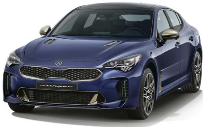
기아차 스팅어 마이스터