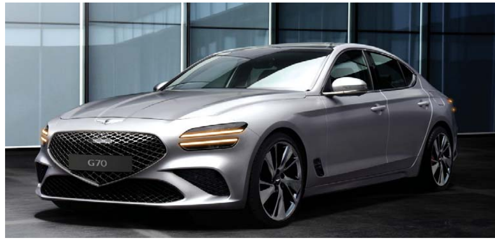
제네시스 더 뉴 G70