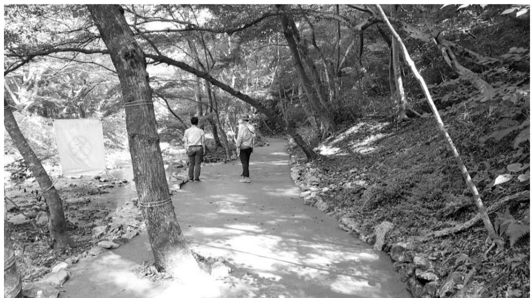
정읍시가 도비 3억원을 지원받아 내장산 탐방로에 '우드칩 황토길'을 조성했다.

개발기본계획 승인을 계기로 새만금 관광·레저용지 개발을 가속화하고 관광 활성화의 마중물로 삼겠다"며 "새만금을 전 세계 관광객이 모이는 명품 관광단지로 조성하겠다"고 말했다. /군산=박금석 기자 nogusu@kwangju.co.kr