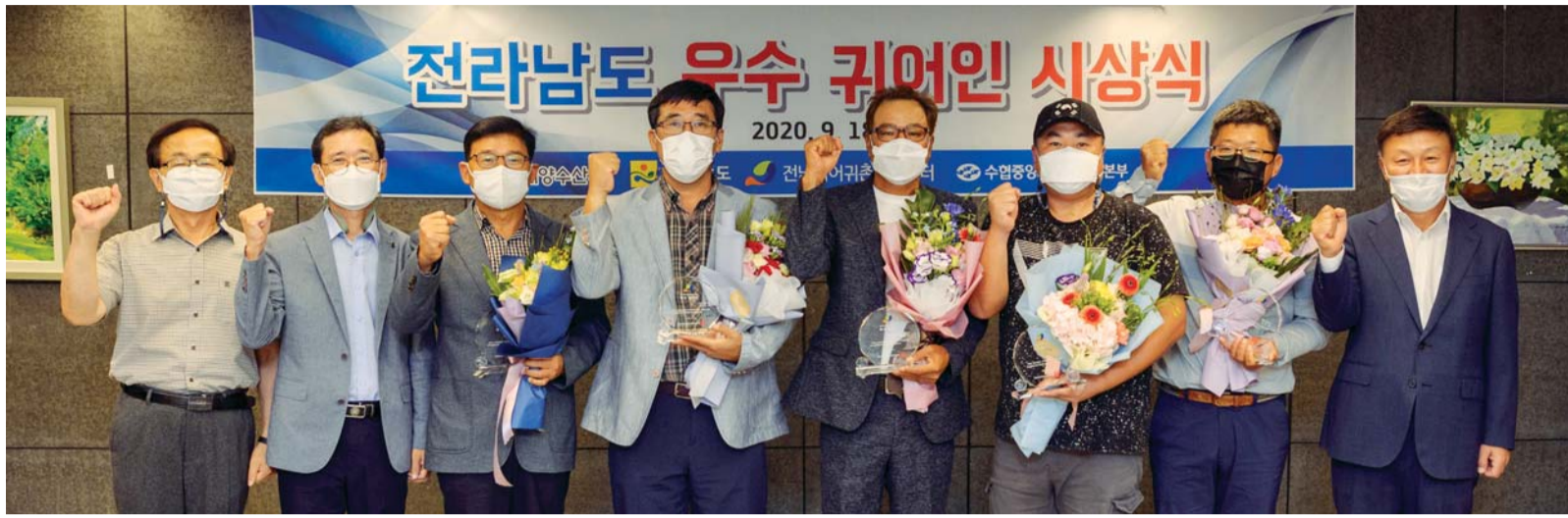
전남 귀어 우수귀어인들이 18일 광주시 동구 ACC호텔에서 기념사진을 찍고 있다.