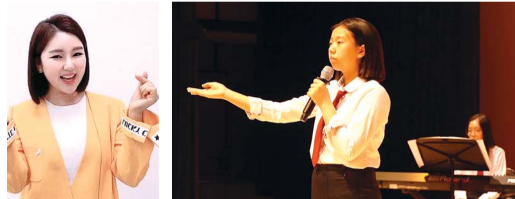
송가인과 운남중 학생밴드 '파토스' 멤버들이 함께 있는 모습. 학생들을 소개해 자신의 꿈을 찾아가도록 최선을 다하겠다"고 밝혔다. /김대성 기자 bigkim@

이번 영상에는 대세 트로트 가수 송가인이 출연해 광주지역 학생들을 향한 응원의 메시지를 전달했다. 송가인은 앞서 광주 '미르밴드'를 소개했던 동방신기 출신 유노윤호처럼 기와 재능을 갖춘 광주지역 학생들을 응원했다. 송가인은 광주예술고 국악과 졸업 후 광주 지역 학생들에 대한 꾸준한 관심과 애정을 보여 왔으며, 광주시교육청의 '빛고를 광주교육 스타발굴단' 출연 제안에 흔쾌히 수락했다. 장휘국 광주교육감은 “우리 광주지역 학생들에