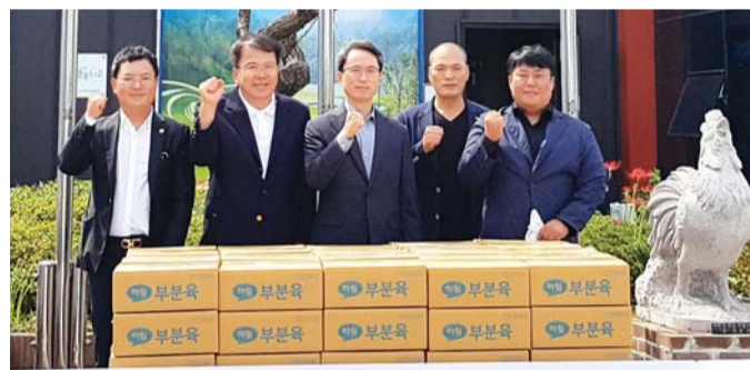
한국법무보호복지공단 광주전남지부 협의회(회장 표래식)가 추석을 맞아 법무보호대상자 200가정에 긴급재난지원물품을 지원했다.