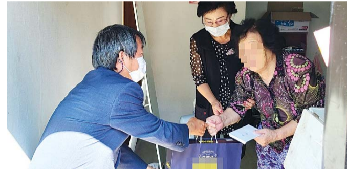
광주전남지방병무청(청장 황영석)이 최근 추석을 맞아 복지 사각지대에 있는 어려운 이웃 4개 세대를 방문해 위문품과 선물을 전달했다.