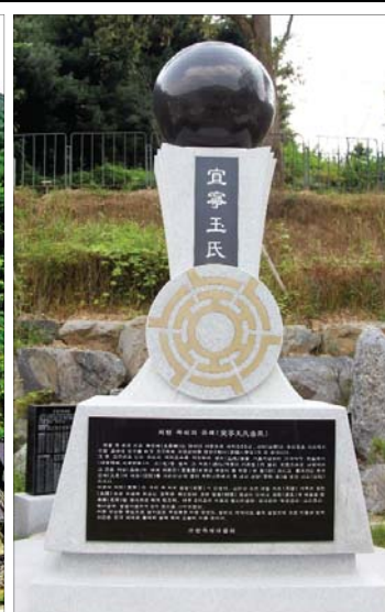
◆ 의령옥씨 상징탑