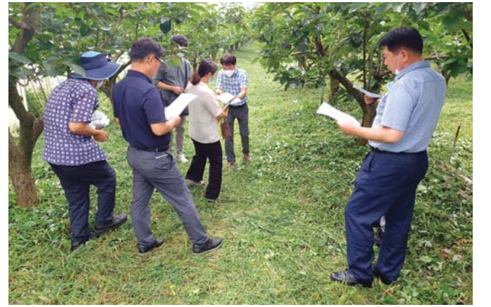
장성군 관계자들이 한 과수농장에서 낙과피해 등을 조사하고 있다.

열풍방상팬은 지주하단부에 설치된 열풍시스템의 뜨거운 공기를 강제 순환시켜 저온이나 서리 피해를 줄여준다. 미세 살수장치는 과수원 내에 안개처럼 물을 뿌려 주위의 온도를 상승시킨다. 장성군은 농업재해로 시름을 앓고 있는 과수농가의 빠른 재기와 이상기온에 대한 선제적 대응을 위해 추경예산 포함 사업비 2억3000만원을 확보하고 지원을 추진할 방침이다.