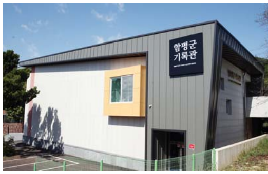
기록물 등을 보관할 수 있는 이동식 서가(모빌랙) 94동과 기록관리 업무를 전담할 기록연구사 등 전문인력을 상시 배치한다.

함평지역의 귀중한 역사 기록들을 한 곳에 모아 보존할 함평군기록관이 문을 연다. <사진> 함평군은 군청 인근 옛 선거관리위원회 부지에 연면적 589㎡, 지상 2층 규모의 함평군기록관을 오는 27일 공식 개관한다고 6일 밝혔다. 함평군은 기록물의 체계적인 관리와 보존을 위해 현대식 기록관이 필요하다고 보고 지난 2018년부터 2년간 기록관 신축을 추진했다. 기록관에는 열람·사무실과 보존서고, 향음·향습 공기순환시설, 가스식 자동소화시설 등 최신식 보존시스템을 갖췄다. 20여만권의 일반문서와 행정 박물관, 도면, 시청각