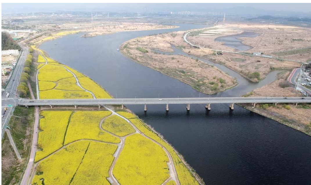
하늘에서 바라본 나주 영산대교.

나주 대호수변공원을 이용하는 시민들에게 편의를 더해 줄 시계탑이 세워졌다. 나주시는 지난 5일 대호수변공원 잔디광장에서 NH농협은행 나주시지부와 함께 '대호수변공원 시계탑 제막식'을 진행했다. <사진> 시계탑은 공원 내 체육·놀이시설과 산책로를 이용하는 주민 편의를 위한 공익사업의 일환으로 농협 나주시지부에서 기증해 설치됐다. 유럽풍 디자인의 높이 4.5m, 반경 2m크기로 하루 시간 정보 제공과 함께 야간시간대 은은한 조명을 밝혀 새로운 경관 명소가 될 전망이다. 박내춘 농협은행 나주시지부장은 "농협을 애용해 주신 시민들의 성원에 보답하고자 대호수변공원에 시계탑을 설치했다"며 "앞으로도 시민의 삶의 질 향상과 지역사회 발전을 위한 다양한 공헌활동을 지속해가겠다"고 말했다. /나주=김민수 기자 kms@