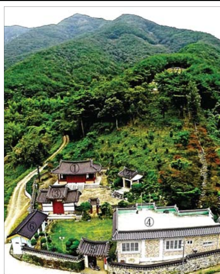
◆ 의춘사 전경